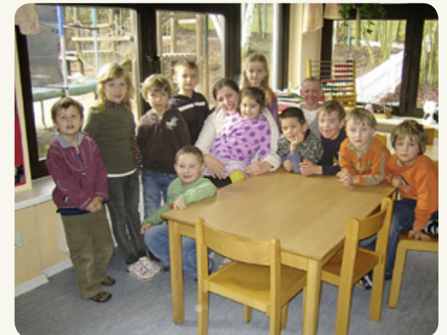
Ausgelagerter Arbeitsplatz Kindertagesstätte