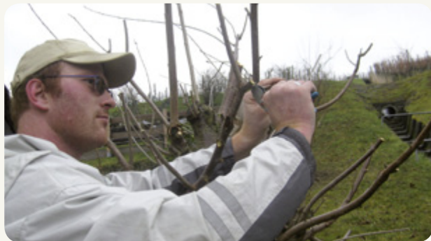
Ausgelagerter Arbeitsplatz Garten- und Landschaftsbau

Gerne beraten wir Sie über die unterschiedlichen Angebote zur Teilhabe am Arbeitsleben.