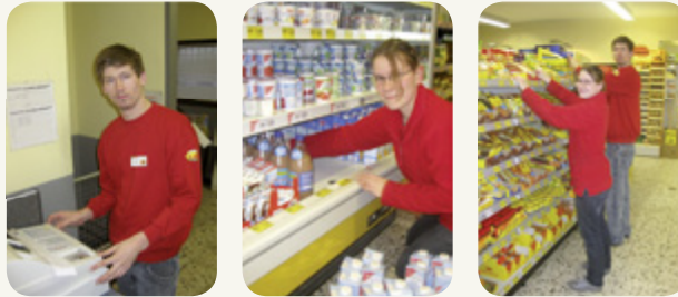
Ausgelagerter Arbeitsplatz Lebensmittelmarkt